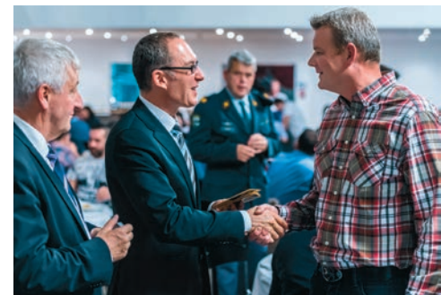
Entlassungsfeier in Chur. Die Gestaltung des Anfangs und des Endes der militärischen Dienstpflicht ist Aufgabe des Kantons.