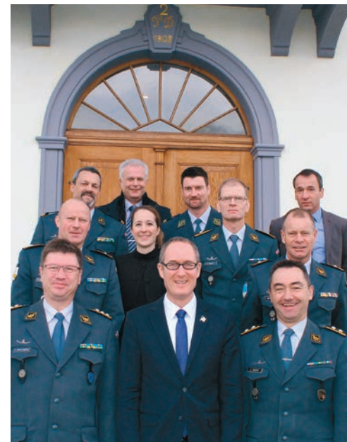
Generalstreffen in Bonaduz

Linke Seite: Der Panzerschiessplatz Hinterrhein, ausgestattet mit den modernsten Ziel-darstellungsmitteln, ist einer der wenigen Plätze in der Schweiz, auf denen das Gefecht der verbundenen Waffen im scharfen Schuss geübt werden kann.