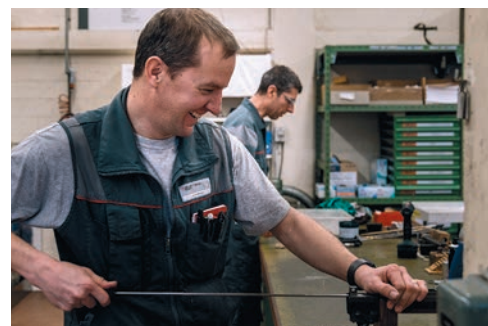
Die Armee bietet im Kanton Graubünden 150 zivile und militärische Arbeitsplätze an.