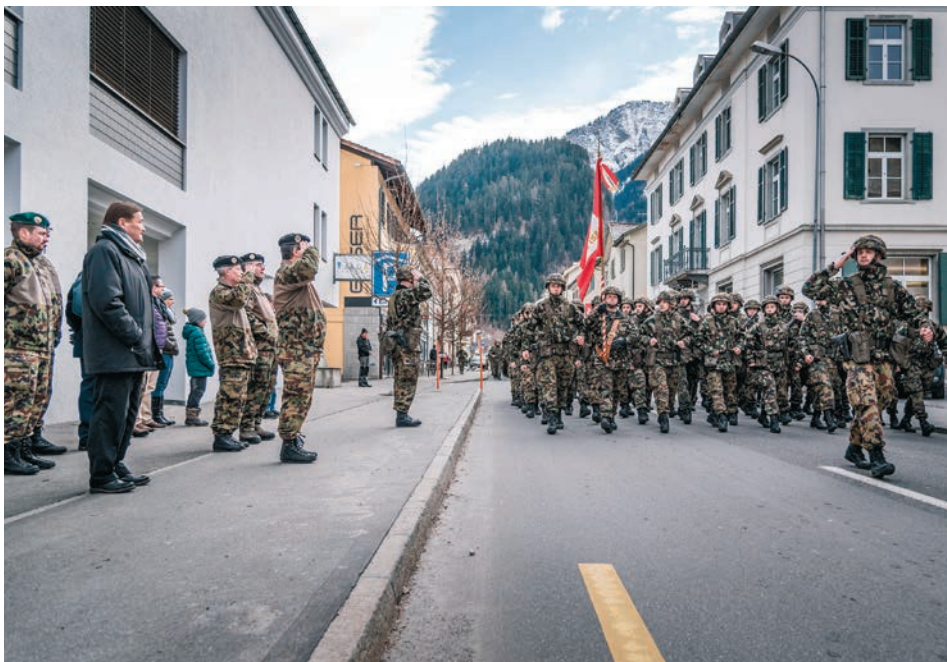
Vorbeimarsch des Gebirgsinfanteriebataillons 48 in Thusis