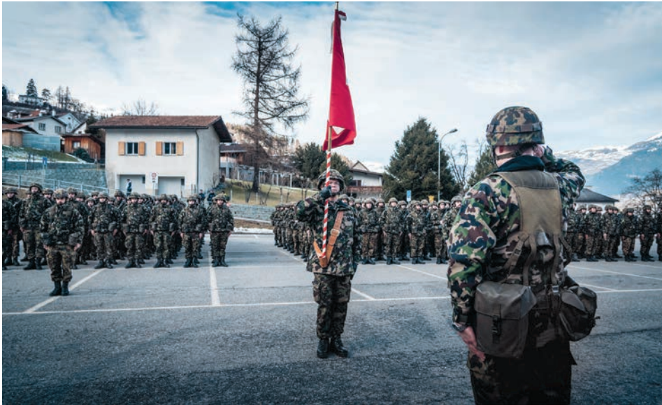
Fahnenübernahme des Gebirgsinfanteriebataillons 48 in Thusis

Bund und Kantone sorgen im Rahmen ihrer Zuständigkeiten für die Sicherheit des Landes und den Schutz der Bevölkerung. Die Gewährleistung der Sicherheit hat für den Kanton Graubünden zentrale Bedeutung. Diese wird in normalen und besonderen Lagen durch die Partner des Bevölkerungsschutzes gewährleistet. Hierzu zählen im Kanton Graubünden zusätzlich zu Polizei, Feuerwehr, Gesundheitswesen, Zivilschutz und Technischen Betrieben auch die Naturgefahrenkommissionen. Bei ausserordentlichen Ereignissen kann der Kanton Graubünden überdies auf die Schweizer Armee zählen.