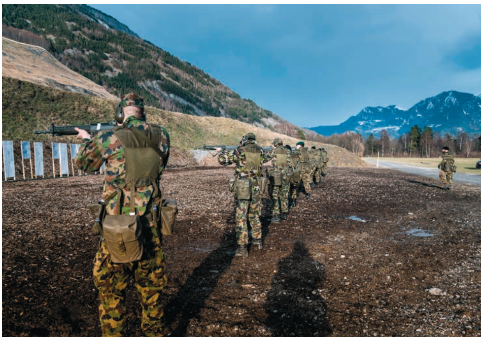
Infanteristen trainieren vor dem WEF die Handhabung der persönlichen Waffe.