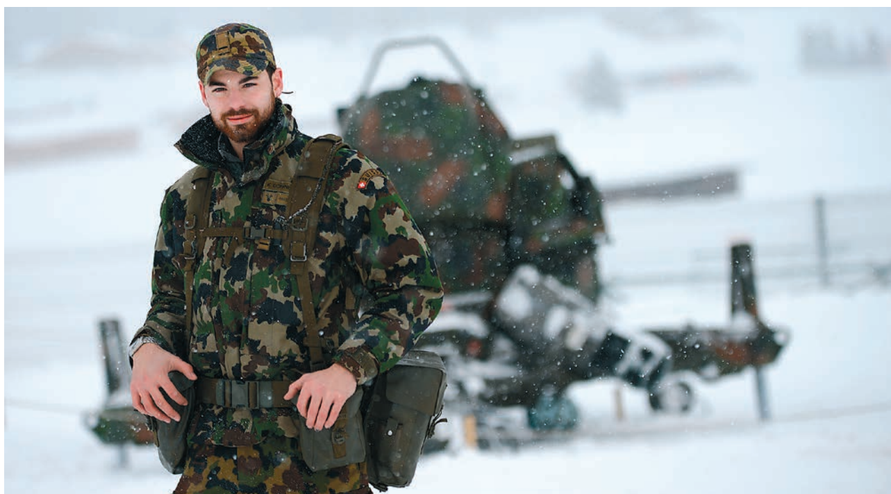
Die Fliegerabwehr trägt zur Sicherung des Luftraums über dem WEF in Davos bei. Die Gewährleistung der Sicherheit am WEF generiert alleine in Davos jährlich einen Umsatz von rund 60 Millionen Franken.