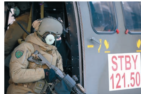
Bis zu 5000 Armeeangehörige unterstützen die zivilen Sicherheitskräfte am Boden und aus der Luft bei der Gewährleistung der Sicherheit am WEF.