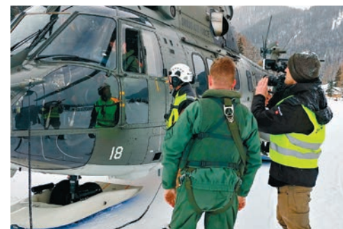
Oben: Wehrpflichtige werden nach Möglichkeit ihren beruflichen Qualifikationen entsprechend eingesetzt.