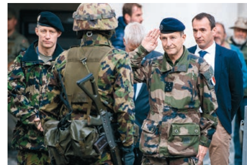
Der Chef des französischen Generalstabs, General Pierre de Villiers (2. v. r.) besucht die Infanterie Rekrutenschule 12 in Haldenstein.