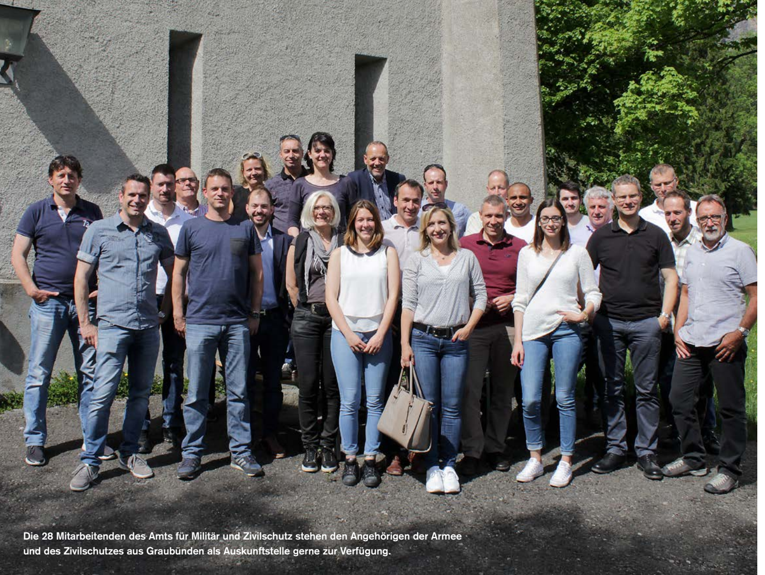
Die 28 Mitarbeitenden des Amtes für Militär und Zivilschutz stehen den Angehörigen der Armee und des Zivilschutzes aus Graubünden als Auskunftsstelle gerne zur Verfügung.