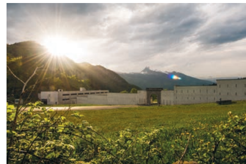
Der Bund betreibt neben dem Panzerschiessplatz Hinterrhein Waffen- und Schiessplätze in Chur, Brigels, S-chanf und St. Luzisteig.