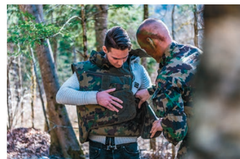
Ein Orientierungstageilnehmer probiert die Schutzweste an.